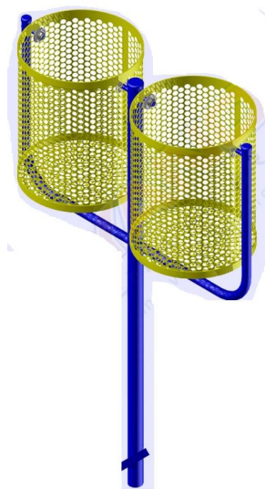
Figura 5 - Modelo de lixeira