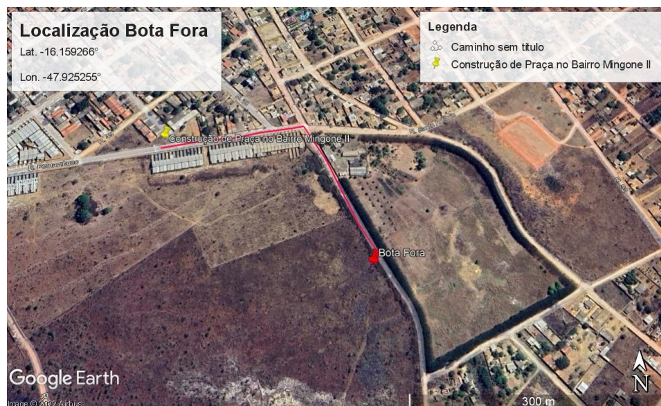
Figura 3 - Localização do bota fora

Vale ressaltar que no cálculo do transporte foi considerado um percentual de empolamento de 25% sobre o volume de entulho gerado.