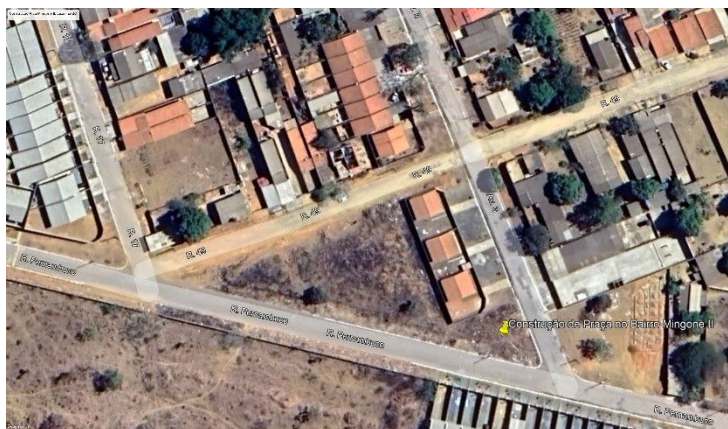
Figura 2 - Croqui de Localização

A obra em questão consiste na execução da Implantação de Praça, localizado na Avenida 03, Rua Pernambuco, Quadra 155, Bairro Parque Industrial Mingone, Município de Luziânia-GO, conforme croqui de localização abaixo: