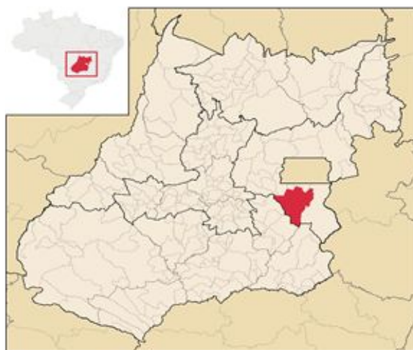
Figura 1 - Mapa de localização do município de Luziânia-GO

O município de Luziânia possui dois aglomerados urbanos principais, os quais são a própria cidade e seu centro, além de setores e bairros periféricos (que se estendem ao longo da margem da BR-040) e o distrito do Jardim do Ingá, localizado no norte da cidade, com uma população de quase 100 mil habitantes, fazendo do distrito o quarto maior do estado. O Jardim do Ingá é dividido em 24 bairros. A maioria da população residente no Jardim do Ingá trabalha no Distrito Federal.