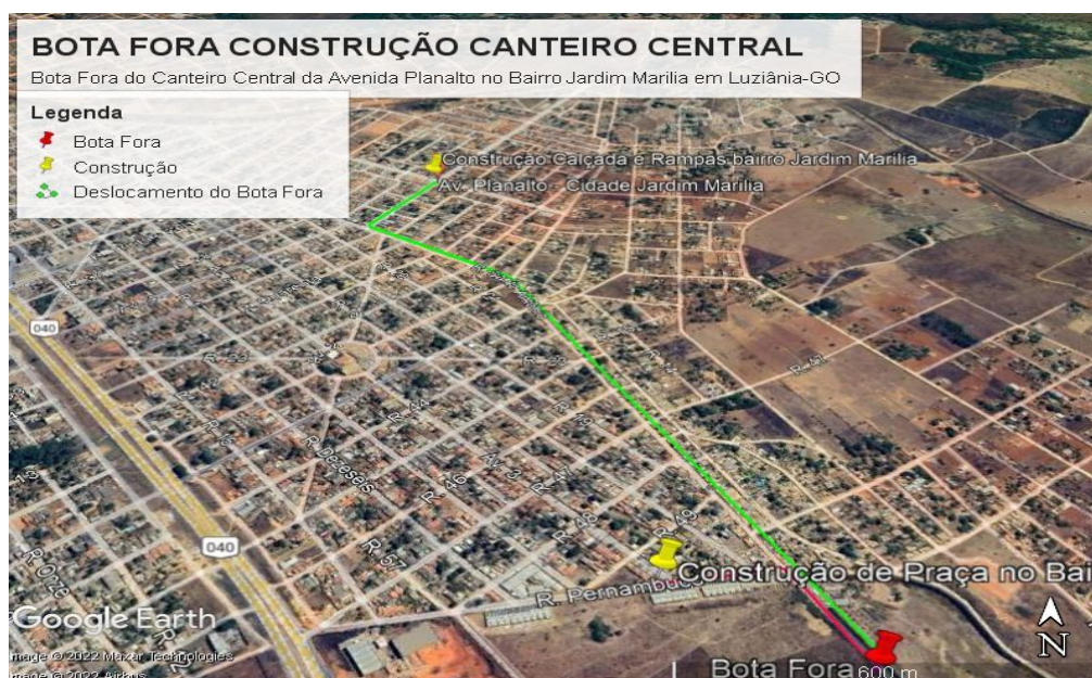
Figura 3 - Localização do bota fora. Lat. -16.15266°, Long. -47.925255°

Vale ressaltar que no cálculo do transporte foi considerado um percentual de empolamento de 25% sobre o volume de entulho gerado.