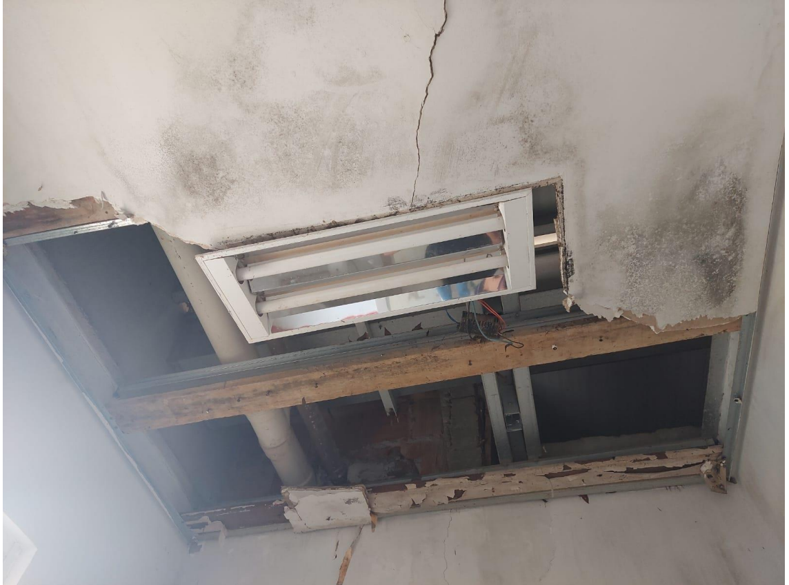
Forro de Gesso acartonado danificado