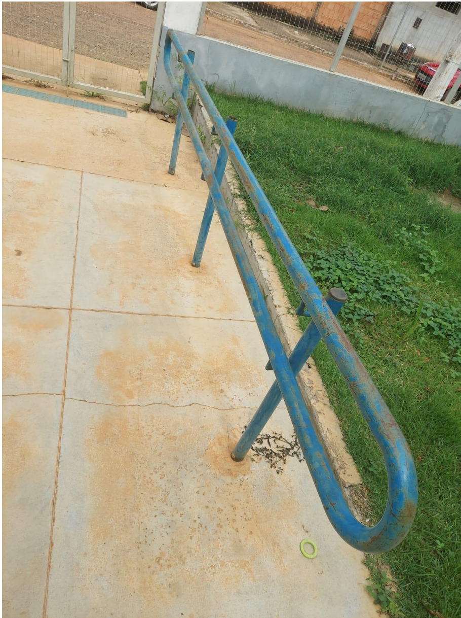
Pintura do corrimão danificada