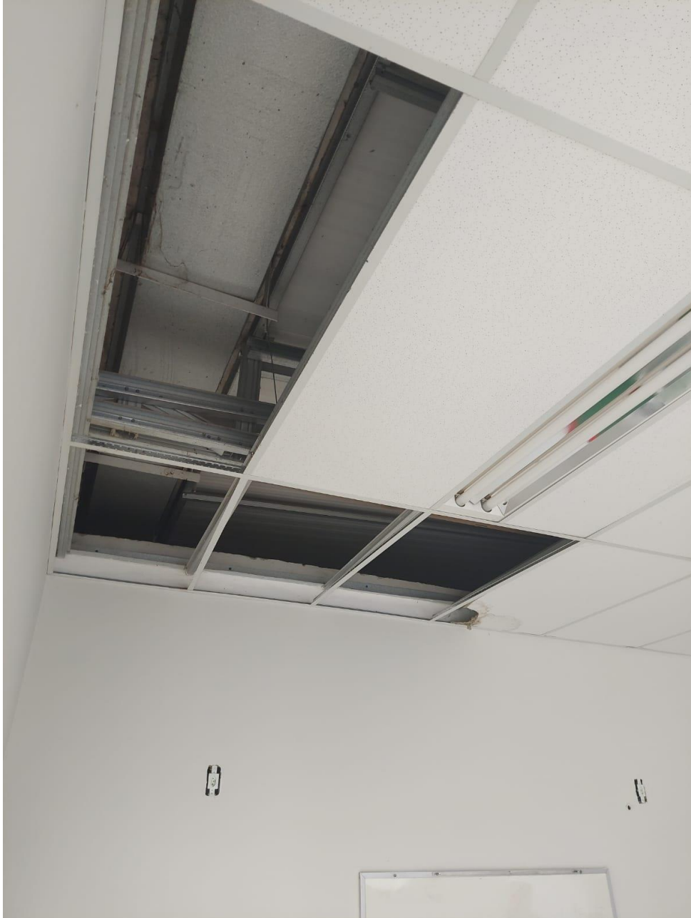
Forro de Fibras de Mineral faltando