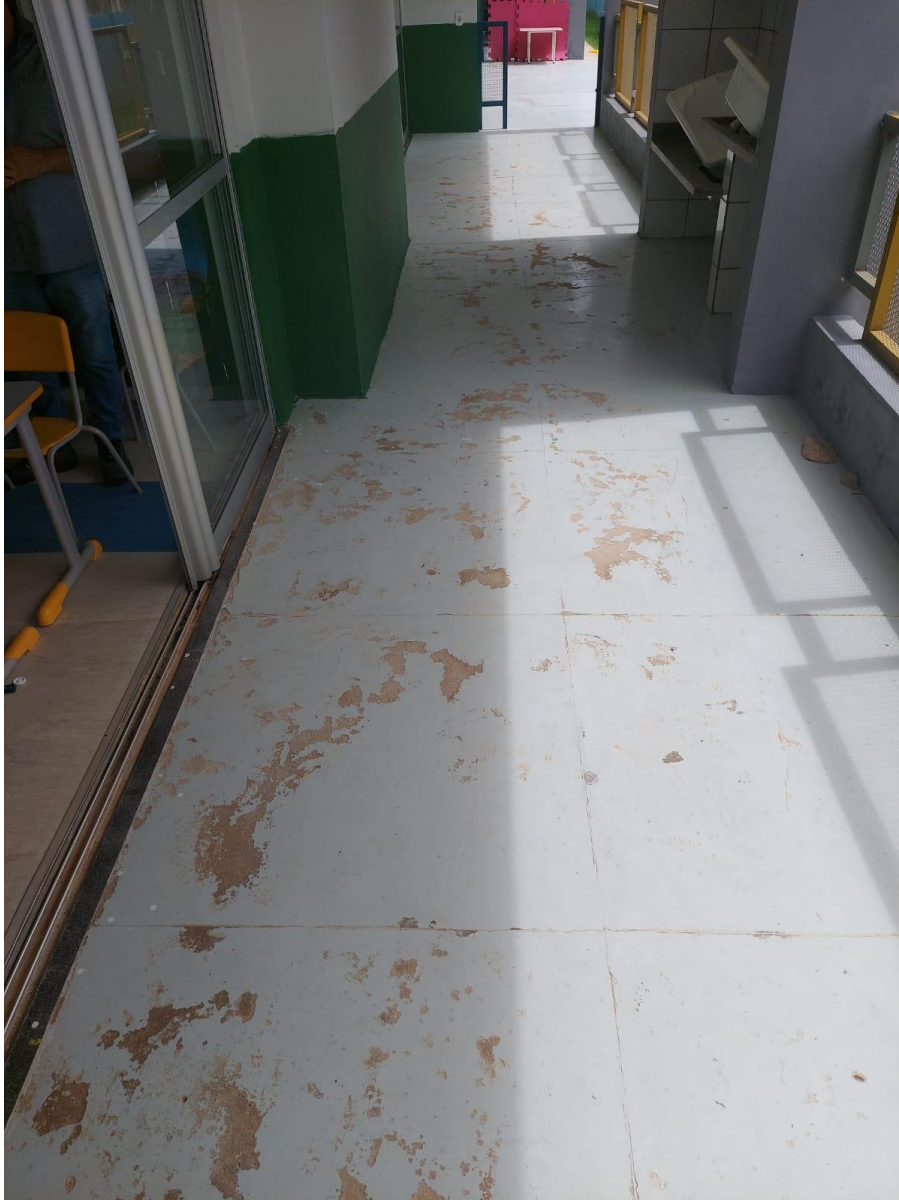
Piso com Pintura danificada