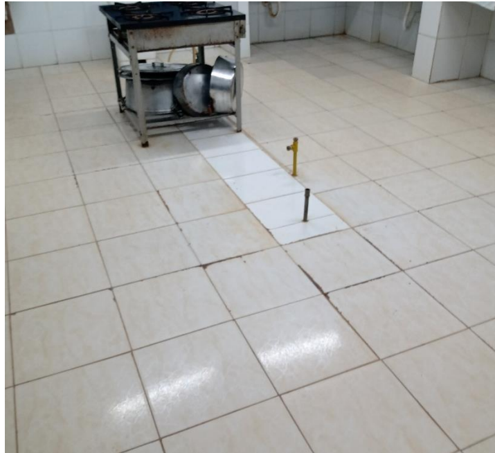
Imagem 03: Piso da cozinha.