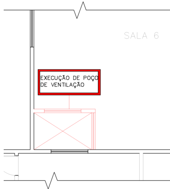
Figura 03: Poço de ventilação a ser feito na cozinha.