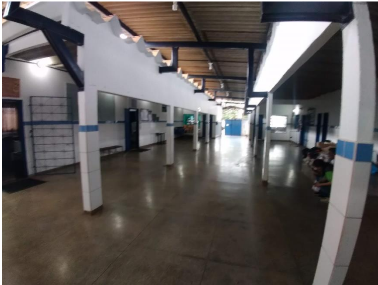
Imagem 01: Telhado da escola.

sua extensão. O padrão de telhas existente na escola é telhas fibrocimento TIPO CALHETÃO (Imagem 01). As telhas defeituosas que forem retiradas devem ser depositadas em local adequado. As telhas novas que forem necessárias, não poderão apresentar defeitos de fabricação, ou de manuseio inadequado, tais como: trincas, protuberâncias, depressões, remendos, etc. Devem ser tomados todos os cuidados necessários. Uso obrigatório de Equipamento de Proteção Individual (EPI). É proibido o trabalho em telhados durante períodos de chuva ou vento fortes. Uso de mão-de-obra habilitada.