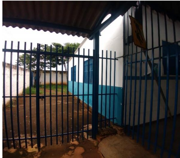
Imagem 06: Grade de saída da escola.