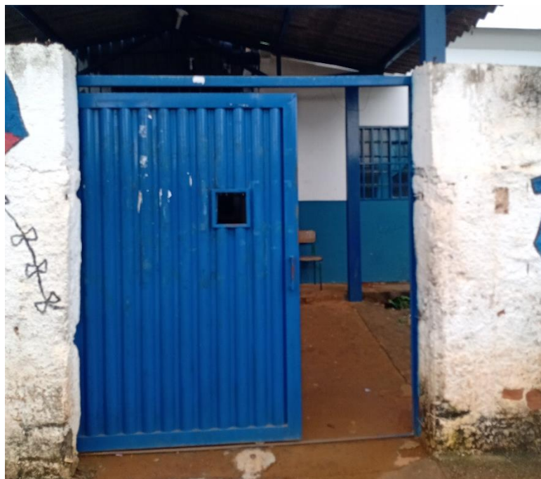
Imagem 05: Portão externo da escola.

Deverá ser feita a pintura do portão de entrada, com esmalte sintético na cor branca. Bem como a pintura dos portões interno (Imagem 05), com esmalte sintético na cor azul, conforme padrão de cor especificado no Manual de identidade visual para obras públicas do município de Luziânia-GO, que está em anexo. Antes de executar o serviço, deve-se realizar a limpeza das portas, e caso seja necessário, em pontos de corrosão, deve-se avaliar o uso de massa plástica para a regularização.