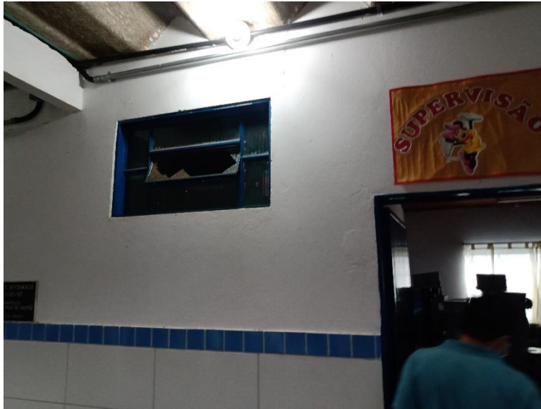
Imagem 02: Exemplo de vidro quebrado.