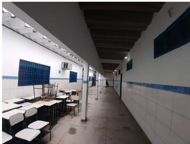
Imagem 04: Exemplo de parede, pilar e viga.

As vigas e os pilares à mostra (Imagem 04), deverão ser pintados com tinta acrílica na cor cinza, conforme padrão de cor especificado no Manual de identidade visual para obras públicas do município de Luziânia-GO, que está em anexo. O mesmo vale para as juntas dos tijolinhos.