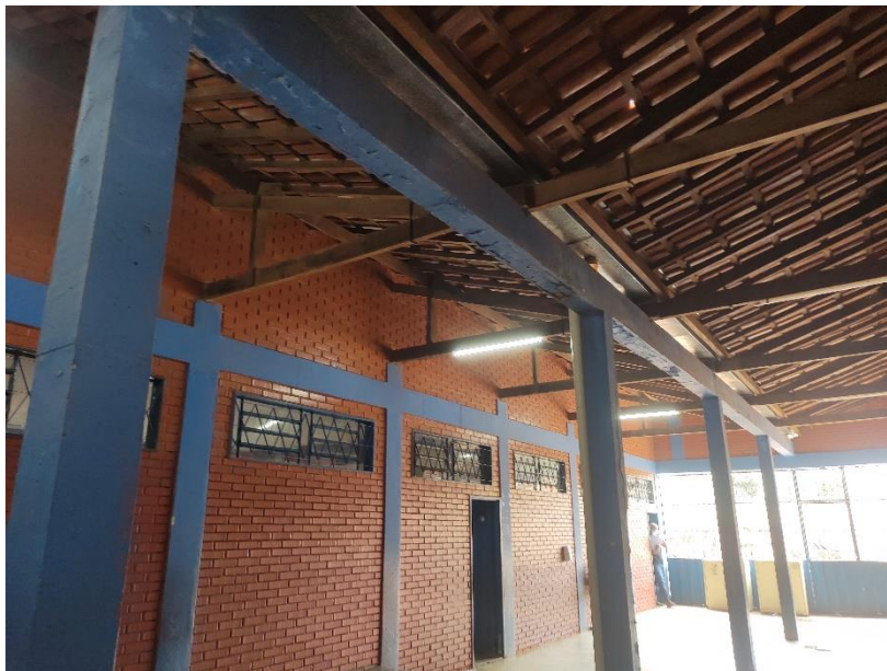
Imagem 03: Exemplo de parede, pilar e viga.

As vigas e os pilares à mostra (Imagem 03), deverão ser pintados com tinta acrílica na cor cinza, conforme padrão de cor especificado no Manual de identidade visual para obras públicas do município de Luziânia-GO, que está em anexo. O mesmo vale para as juntas dos tijolinhos.