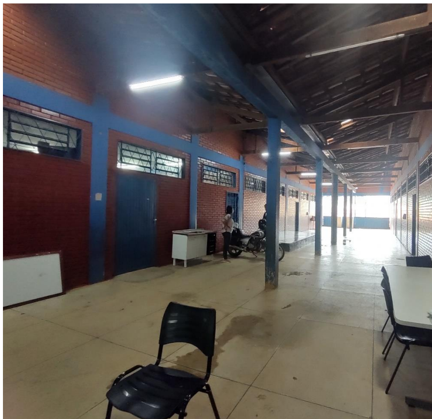
Imagem 01: Telhado da escola de telha plan

caracterizado que o telhado necessita de revisão geral em toda a sua extensão. O padrão de telhas existente na escola é telhas cerâmicas TIPO PLAN (imagem 1) e CANALETE 90 (imagem 2). As telhas defeituosas que forem retiradas devem ser depositadas em local adequado. As telhas novas que forem necessárias, não poderão apresentar defeitos de fabricação, ou de manuseio inadequado, tais como: trincas, protuberâncias, depressões, remendos, etc. Devem ser tomados todos os cuidados necessários. Uso obrigatório de Equipamento de Proteção Individual (EPI). É proibido o trabalho em telhados durante períodos de chuva ou vento fortes. Uso de mão-de-obra habilitada.