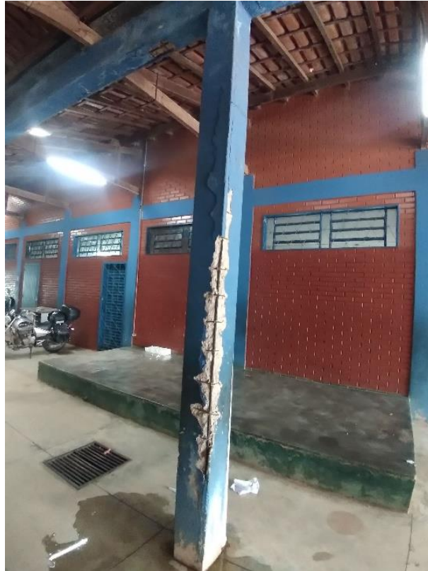
Imagem 05: pilar a ser reparado