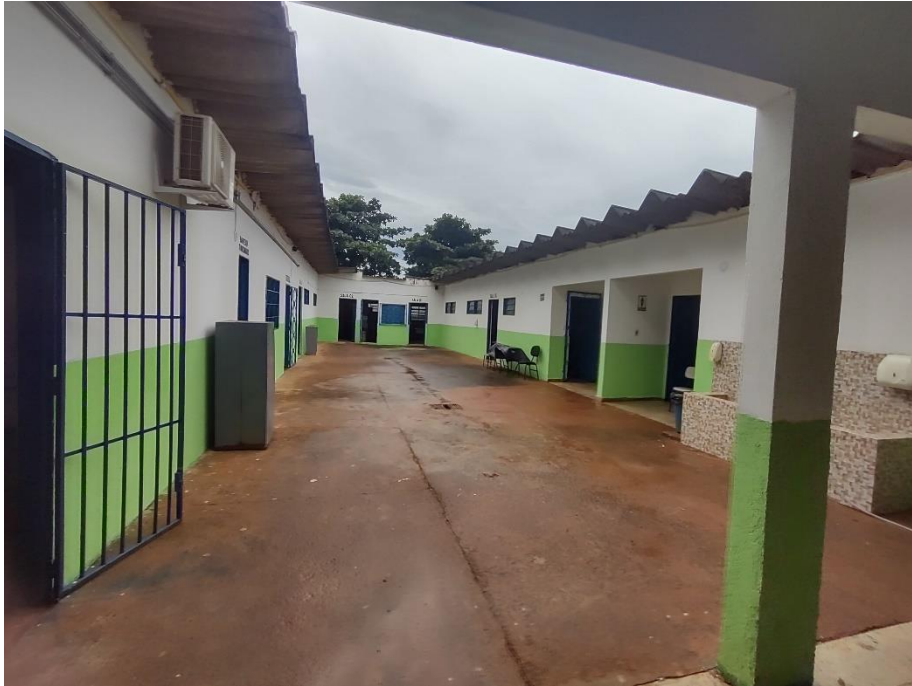
Imagem 02: Telhado da escola de telha canaleta 90