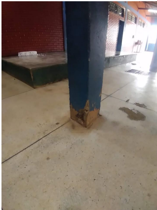
Imagem 04: pilar a ser reparado

Deverá ser feito o reparo de 2 pilares danificados de 0,20m x 0,20m conforme imagem 04 e 05.