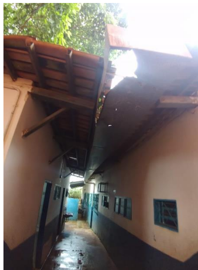
Imagem 02: Telha Padrão