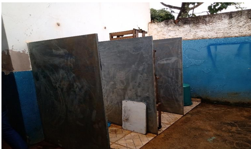
Imagem 08 - Criar banheiro infantil