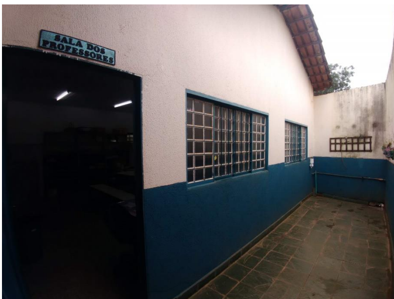
Imagem 03: Acesso à sala dos professores