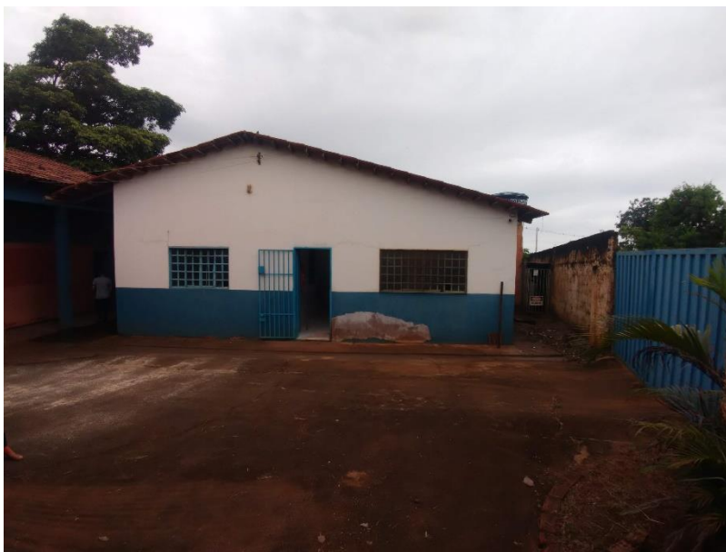
Imagem 04: Acesso à cozinha