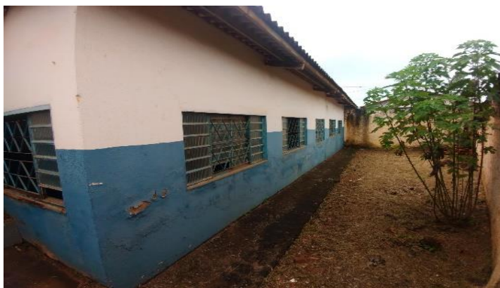
Imagem 06: Exemplo de parede a ser pintada